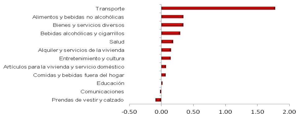
Gráfico 1. Costa Rica: Variación mensual del IPC por Grupo. Junio 2015