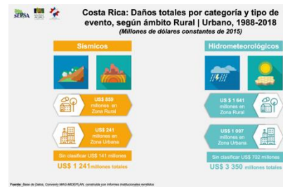
Infografía Cambio Climático

Adicionalmente, se trabajó series de infografías en temas como Cambio Climático, Frijol, Boletín Estadístico Agropecuario No.30, prevención y medidas tomadas por el Sector Agropecuario Costarricense ante el COVID-19, entre otras, que arrojaron resultados positivos en su visualización, así como fueron compartidos por otras páginas de instituciones relacionadas con el Sector Agropecuario.